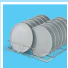
Platos de pizza de 14x320 mm