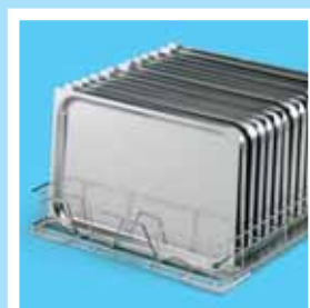
Bandejas 14x1/1 GN